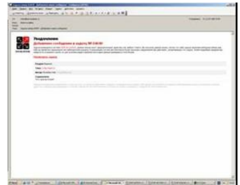
Рис. 2. Уведомление о добавлении сообщения в задачу. На экране видно раздел, автора, тему задачи. По ссылке можно перейти на экран с подробным описанием задачи и хода ее выполнения