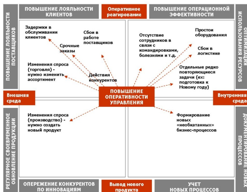
Рис. 1. Зачем нужна автоматизированная система оперативного управления