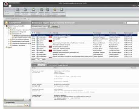
Рис. 2. Рабочее окно: в левой части дерево разделов, в правой список задач из выделенного раздела и история выделенной задачи